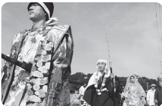
義経に扮した方を先頭に義経ロードを巡る

芝田婦人会主催の義経夢想祭が2月17日、芝生町の旗山周りで開催され、多数の家族連れなどが訪れました。