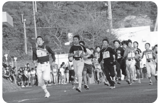
タスキに想いをつなぎ疾走する選手たち