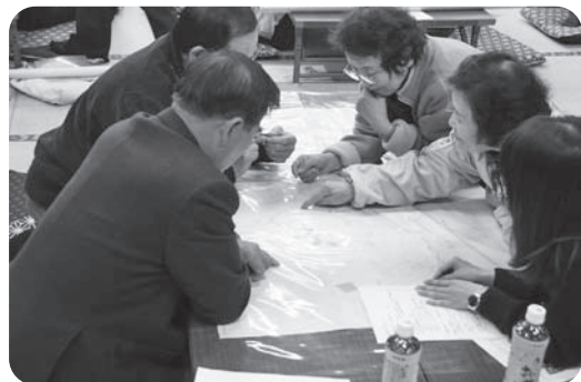
ささえあいマップを製作する地域住民の方々

昨年6月に『横瀨地区災害時要援護者見守りネットワーク連絡会』が発足しました。これは、障がいをもつ方や高齢者、妊婦など災害時に避難支援が必要な方に対して、情報提供や避難の手助けを地域の中で迅速かつ安全に行われる体制づくりを行うものです。 2月15日には、災害時避難支援計画の一環として、ささえあいマップを製作。同情報は各関係機関と共有し、災害が発生した時に活用されるそうです。