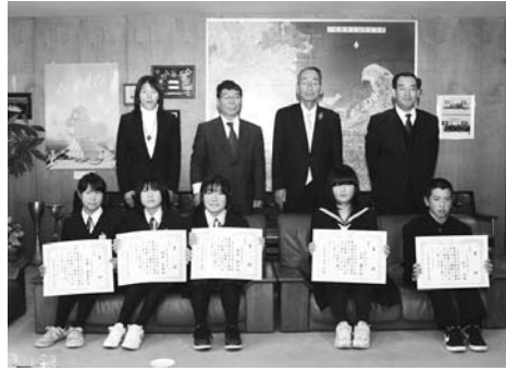
受賞された中学生の皆さん

なお、総合計画の内容につきましては、今月号に折り込みの小松島市第5次総合計画(ダイジェスト版)をご参照ください。