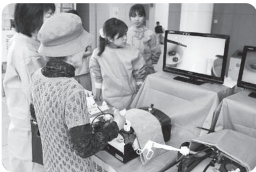
内視鏡手術体験コーナーで操作体験する来場者

地域住民の方と病院職員との交流を深めることを目的に、徳島赤十字病院で毎年開催される病院祭が、今年も4月20日に催されました。