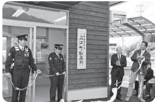
立江町駐在所落成式での同所看板除幕式の様子

小松島警察署立江町駐在所の新築建て替え工事が完了し、4月12日、同駐在所で落成式が行われ、濱田市長や小松島警察署の署員ら関係者約20名が完成を祝いました。同駐在所は老朽化などにより、昨年10月から同敷地内での建て替え工事にかかり、今年3月末に完成。多くの県産材が使用された木造2階建て（延べ床面積約90㎡）で、駐在員の居住施設なども備えています。