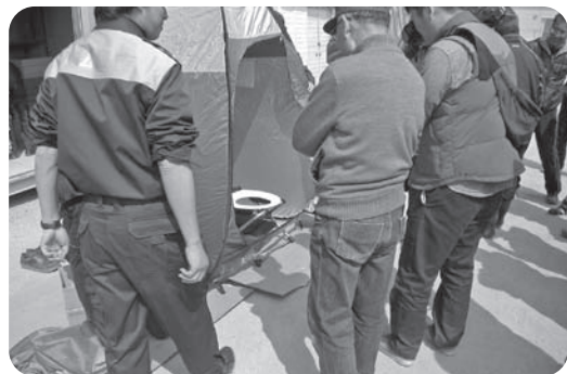
個室用に簡易式トイレを組み立てて説明する様子

同説明会では、配備された資機材（発電機や簡易式トイレ、エアーマットなど）の扱いや電気自動車のデモンストラクションなどを実施。参加者らは防災に活かせるよう、真剣な表情で説明に耳を傾けていました。