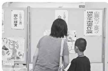
展示された優秀作品を見入る来場者

住民サービスの向上を図るため、小松島市と株式会社サイネックスが、行政や地域の情報を掲載した『暮らしの便利帳』を製作することとなり、6月3日、「小松島市暮らしの便利帳」の共同発行に関する協定を締結しました。