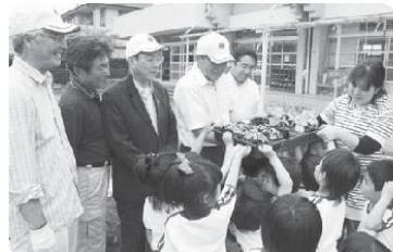
ライオンズクラブ会員より苗を受け取る園児ら

小松島ライオンズクラブが、夏の日差しを和らげる「緑のカーテン」の苗(朝顔やゴーヤ)を、5月30日に事前申込があった小・中学校と幼稚園へ配布しました。訪れた北小松島幼稚園では、園児らが苗を笑顔で受け取っていました。