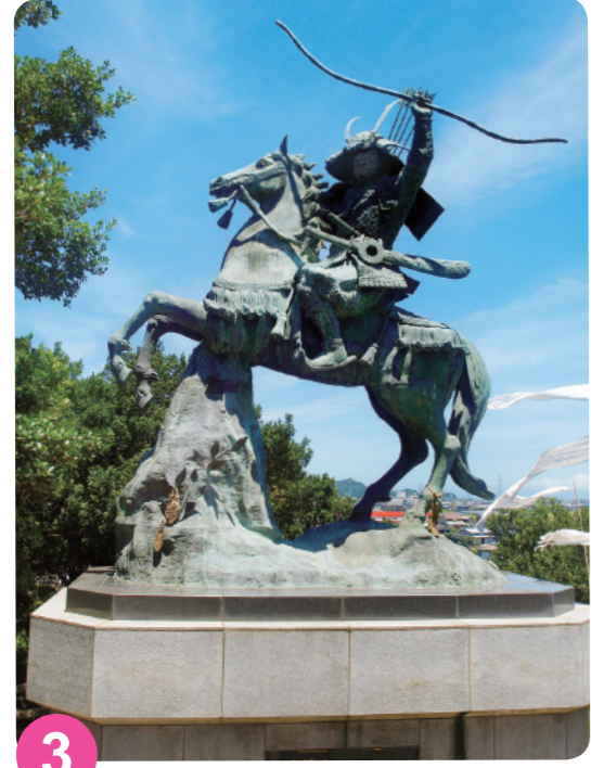
3 源义经骑马像 MAP=C-3 据说“旗山”曾是日本有名的武士“源义经”经过的地方，在此建有日本最高的“源义经骑马像”，像的高度为6.7米。