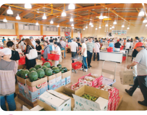
6 JA东德岛 AISAI广场 MAP=D-3 以销售当地的新鲜蔬菜和水果为主的直销店，也出售面包、乌冬面、鱼贝、肉类等。