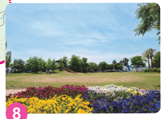
8 潮风公园 MAP=D-2 于2000年春季开园的“潮风公园”。园内有海之纪念碑和以飞机为印象的玩具、滑板场等。