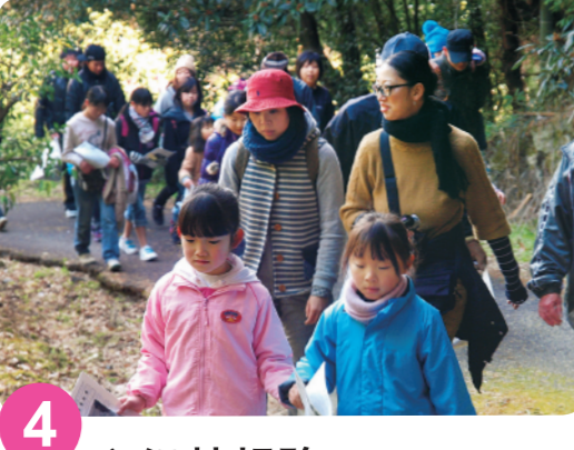
4 源义经梦想路 MAP=B-2~D-3 据说800多年前，日本有名的武士“源义经”曾来过此地，全长10公里，部分道路有坡度。