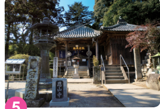
5 恩山寺 MAP=C-3 此为四国地区的八十八个灵场（能量景点）之一，为第十八个灵场。