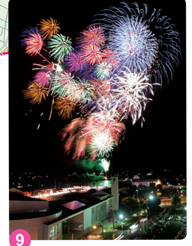
9 小松岛港祭 MAP=D-2 是小松岛市最重要庆典，届时会举办阿波舞和烟花大会。在烟花大会上，将会点放由市内的烟花制造商制作的2,000个五彩缤纷的烟花（举办时期：7月）。