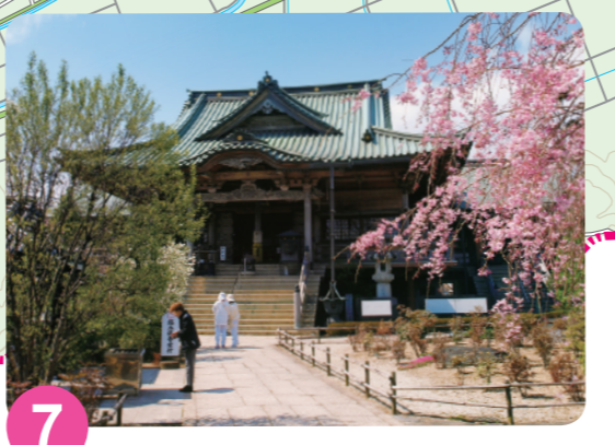
7 立江寺 MAP=D-4 此为四国地区的八十八个灵场（能量景点）之一，为第十九个灵场。