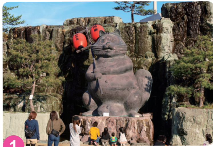
1 小松岛车站公园 MAP=C-2 园内有展示蒸汽火车的“SL纪念广场”和有世界最大狸猫铜像的“狸猫广场”。