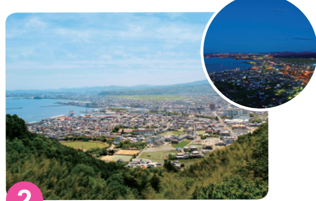
2 日峰山 MAP=C-1 海拔约192米，设于山顶广场的展望台很受欢迎。若天气晴朗的时候，还能眺望到隔海的和歌山县。