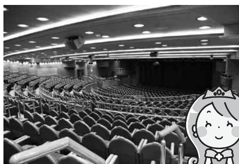
プリンセスシアター