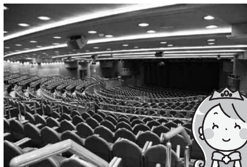
プリンセスシアター